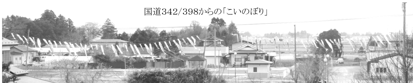
国道342/398からの「こいのぼり」

『浅水の子も達が元気にたくましく成長する』ことを願い、平成6年から続けて今年で17年目となりますが、毎年 地域の皆様や国道342と国道398を通行する皆様そしてサイクリングロードを通学で利用の小学生・中学生・高校生の皆様の楽しみとなっております。 今年では従来の柱が虫喰いで倒れる危険があることから、ふれあいセンターの農村公園側に高さ12m・長さ108mで屋根より高いこいのぼりとして、各行政区の区長さんと浅水の子供たちで掲揚を致しました。