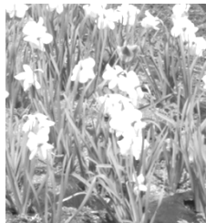
農村公園の水仙が咲きました!!