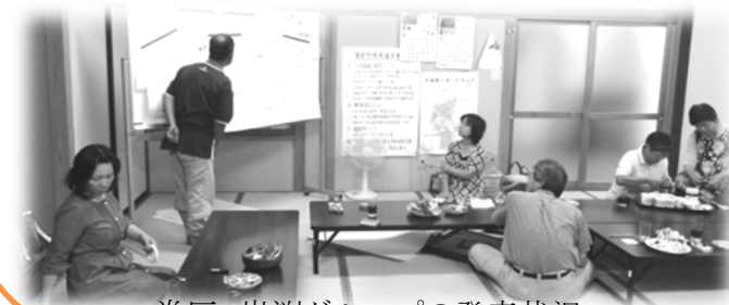
巻区 岩淵グループの発表状況