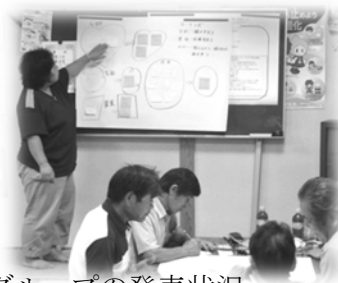
長谷区 ウーマンズグループの発表状況