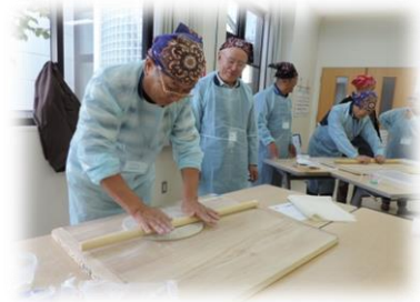
手打ちそばを完成することが

10月22日 参加者9名でルディクウォーク教室を開催しました。久しぶりに参加された方もありますが、スタート時点ではちょっと寒いくらいでしたが約7000歩前後、4, 7キロのウォーキングですっかり体は暖まりました。