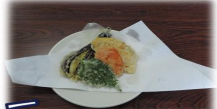
天ぷら(季節の野菜)