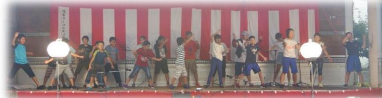
「浅水小児童 よさこい」熱演