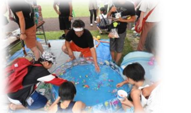
スーパーボールすくい 子ども上手だあ