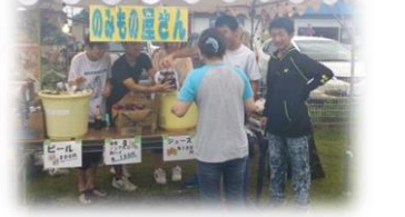
中田中 生徒ボランティア