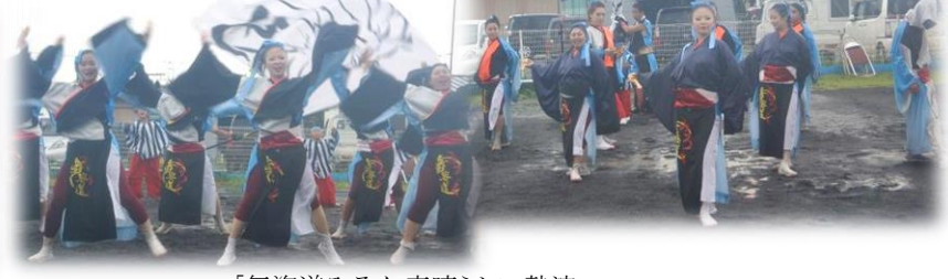
「舞姿道みろく」素晴らしい熱演