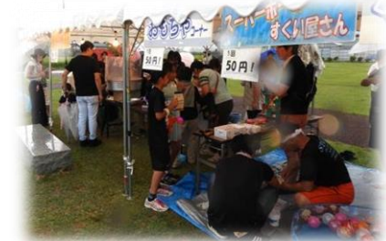
PTA お父さんご苦労様