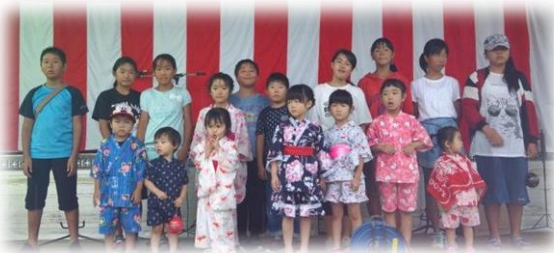
「めんこい ゆかたっこ」とインタビュー児童

を兼ね披露され会場を盛り上げて頂きました。来賓の方々もいい曲だねと評価しておりました。焼きそばと焼き鳥も委員が汗だくで焼いておりましたが、味が良いと好評で、完売することが出来ました。中田中の生徒が地元のまつりをとボランティアで飲物の販売を担当してくれました。今年の夏まつりは委員・スタッフの皆様方のご協力により悪天候の中でも開催することが出来ました。皆様本当に、ありがとうございました。