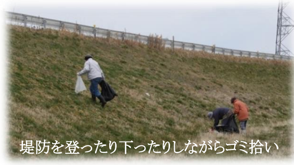
堤防を登ったり下ったりしながらゴミ拾い