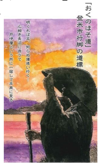
「おくのほそ道」 ～登米市行脚から330年～