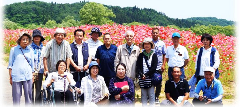
(国営みちのく杜の湖畔公園)

6/5にポピーまつりを見学してきました。天候にも恵まれ、蔵王連峰を背景に赤・白・ピンクのポピーが辺り一面咲き誇り、とても綺麗でした✿ そして、とんとんの丘にある「もちぶた館」で昼食。「天然温泉いい湯」で熱い温泉につかり、日ごろの疲れを癒しながら親睦を深めてきました☺