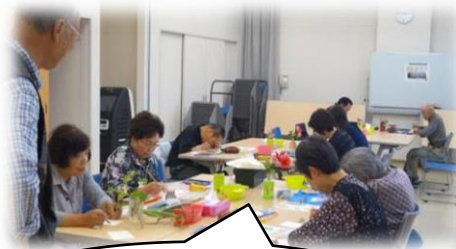
綺麗な花の 絵手紙ができました😊