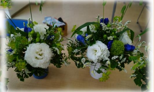
メインのお花は八重のトルコキキョウ