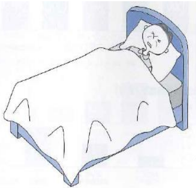
●寝たきり(要介護5)になった主な原因

脳卒中になる前に、生活習慣病をしっかりと治療して予防に努めるか、危険はあってもそのまま放っておくか。あなたなら、どちらを選びますか？