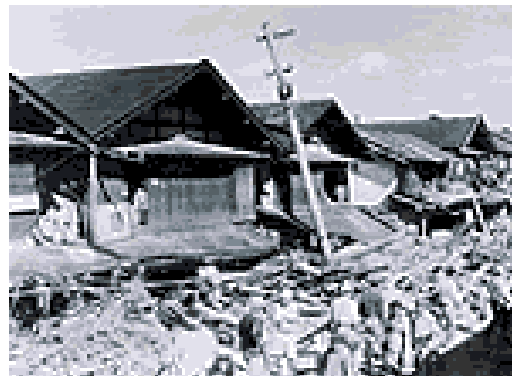
カスリン台風(一関市)