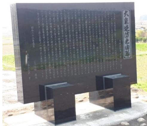
大泉堤防決壊の石碑