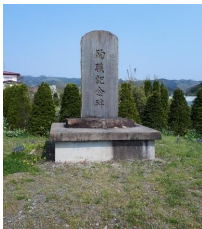
殉職した警察官の石碑

1438年～1947年の 509年間で94回の 洪水・堤防決壊が 発生していた。 中田町史より