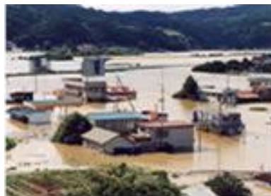
川崎村砂鉄川合流点付近