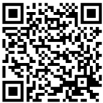
浅水活性化 U Map