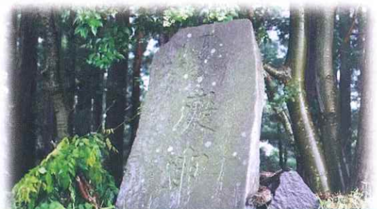
写真は光明寺裏の三叉路に立つ庚申塔です

一度の庚申の日を夜通し過ごしそれを18回(3年)経過の庚申の日を祈念して、集落や村の境目などに置かれました。道祖神のように村や辻の守り神の役割を果たし、また疫病などの結界を兼ねていました。浅水地区にもたくさん見られます。コロナ撃退を祈って、庚申塔周辺のごみ拾い、草刈りなどしてみませんか？環境整備にもつながります。美しい浅水地域を守っていきましょう。