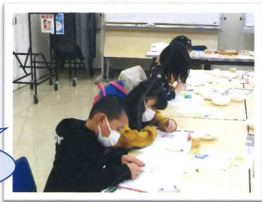
みんなすごい集中力!