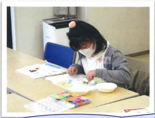
個性豊かな作品の完成☆